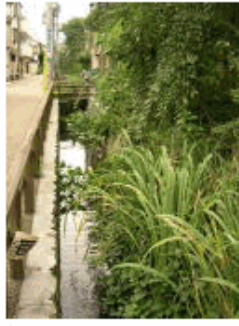
洗足跡・洗足池から香川へ。散歩道として整備。