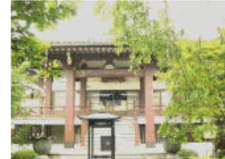
非公開の日蓮上人座像がある。