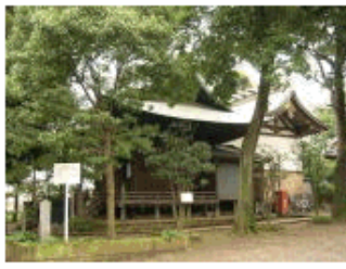
江戸期馬込領久が原村の鎮守。