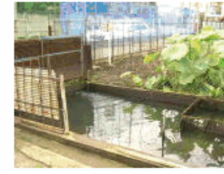
中島家農業用洗い場