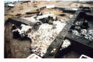
2000年に発掘。縄文時代前期(5000年前)の住居跡・貝塚が多数発見。