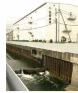
道々橋付近の醍醐倉庫。昭和初期から香川沿いに倉庫群が出来、戦後広がる。香川の未改修部分が見える