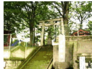
江戸期六郷領久が原村の鎮守。境内に3角点がある。