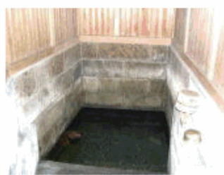
本光寺湧水水垢離場