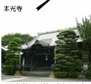
江戸初期の開創。境内に湧水があり、水垢離場がある。