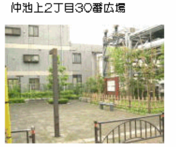
仲池上2丁目30番広場