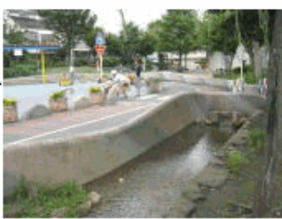
湧水を水源とした水路があり、交通公園、プールもある