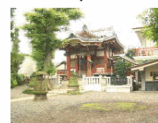
江戸初期の開創。道々橋村の鎮守。境内に児童公園。