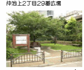
仲池上2丁目29番広場