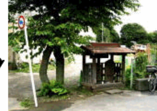
江戸期雪が谷の庚申講の人々が建てた。庚申の日に行事行う。