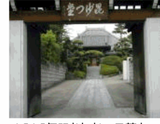
1616年開かれた。日蓮宗。この西側台地に雪が谷貝塚